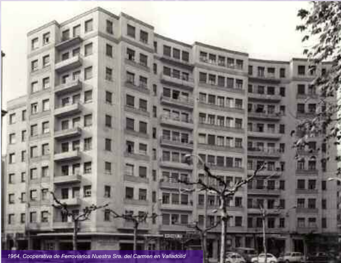
1964. Cooperativa de Ferrovianos Nuestra Sra. del Carmen en Valladolid