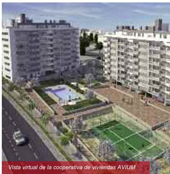
Vista virtual de la cooperativa de viviendas AVIUM