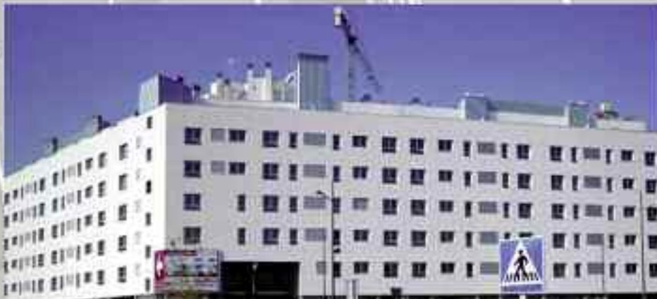
Cooperativa Fuente del Rey, 126 viviendas. Móstoles, Madrid. Gestora: Prygesa

Madrid angelnovillo@etosa.com Sevilla enriquecasasola@etosa.com Málaga juantuismarin@etosa.com Alicante fjserrano@etosa.com Murcia jjdiaz@etosa.com