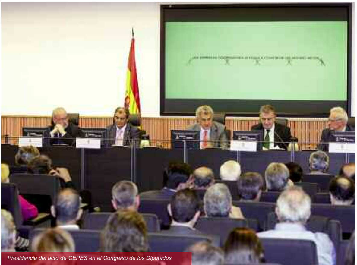
Presidencia del acto de CEPES en el Congreso de los Diputados