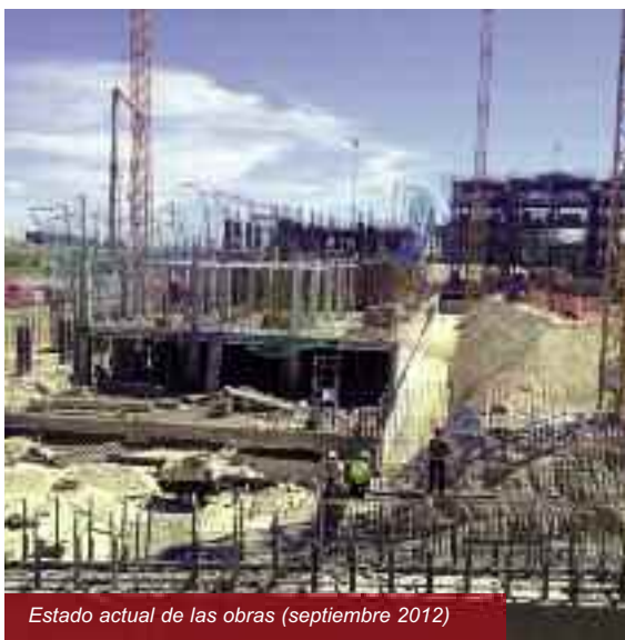
Estado actual de las obras (septiembre 2012)

La promoción será entregada durante el primer trimestre de 2013.